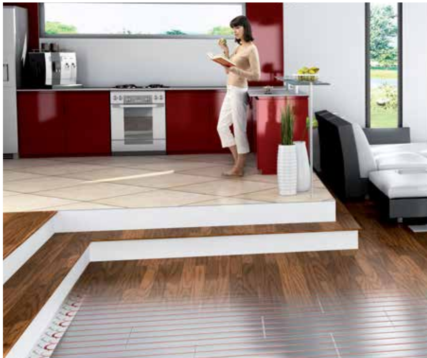
Med T2Röd /T2Reflecta-systemet minskar energiförbrukningen med upp till 20% jämfört med traditionellt inspacklade värmesystem.